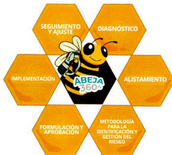
Ilustración 1. Fases formulación general

A continuación, se describen las fases que componen la formulación del Programa de Transparencia y Ética Pública (PTEP) y del Mapa Integral de Riesgos Institucional, detallando en cada una de ellas los objetivos, actividades principales y resultados