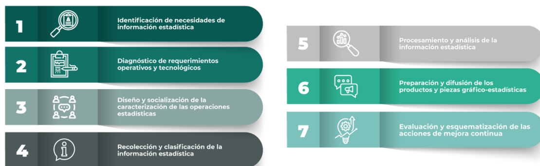
Figura 4. Modelo de producción estadística

En este contexto, la siguiente figura ilustra el modelo de producción estadística propuesto para la gestión y disponibilidad de la información estadística en Unitrópico.