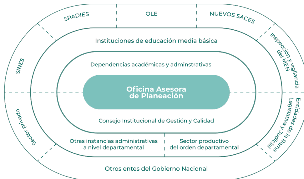
Figura 1. Ecosistema de datos

De esta forma, y como primera instancia, en el centro del Ecosistema se encuentra la Oficina Asesora de Planeación como dependencia articuladora del plan y formuladora de la PGIE.