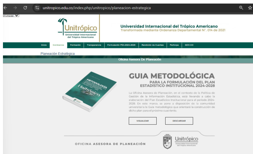
Figura 3. Ilustración Metodología para la formulación del Plan Estadístico Institucional en la página web de Unitrópico

La siguiente figura ilustra el documento metodológico publicado en el micrositio de Planeación Estratégica de la Universidad mediante el cual se dio comienzo al desarrollo metodológico de formulación.